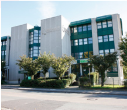
Stauerhaus – Campus Stauerland