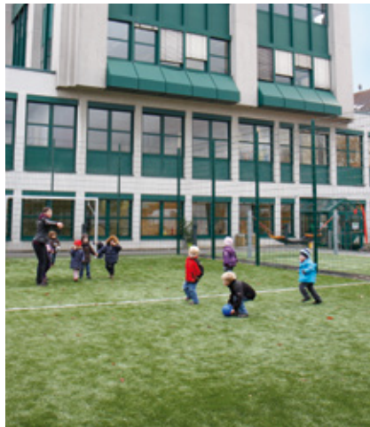
Der Sportplatz bietet viel Bewegungsfreiraum