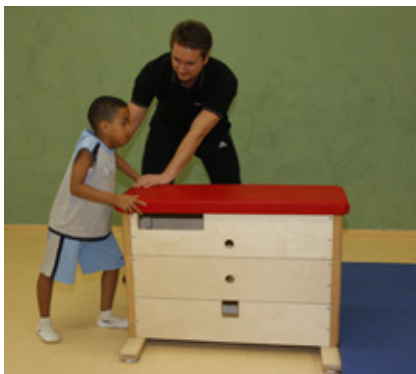
Ein großer Raum für den Sportunterricht