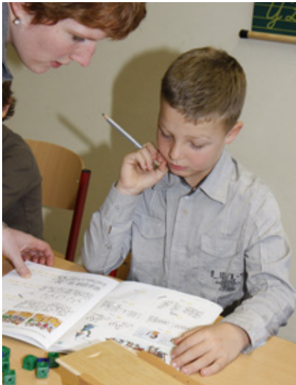
Individuelle Förderung durch kleine Klassen