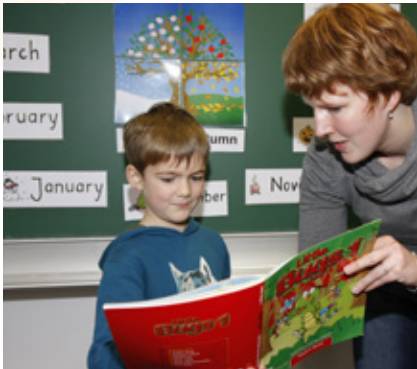
»Eintauchen« in die neue Sprache