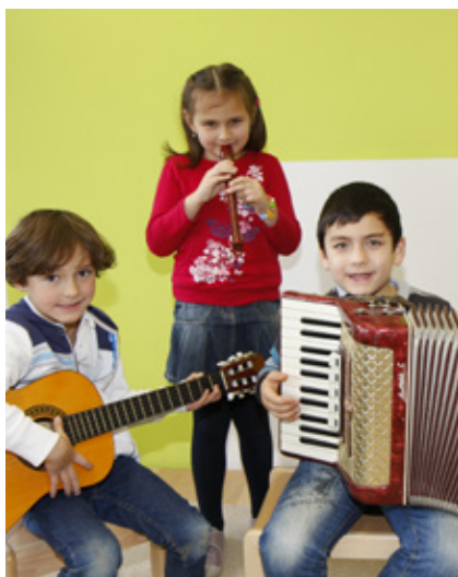
Das gemeinsame Musizieren ist uns wichtig

Der musische Bereich spielt eine wichtige Rolle und wird ergänzt durch Flöten- und Orff-Instrumentalunterricht. Dieser Unterricht findet zunächst in deutscher Sprache, ab Klasse 3 auch in englischer Sprache statt. Durch die Verkürzung der Unterrichtsstunde von 45 auf 40 Minuten stehen im gebotenen Zeitrahmen insgesamt mehr Unterrichtsstunden zur Verfügung.