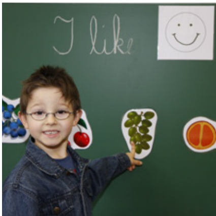
Der Anteil des englischsprachigen Unterrichts beträgt zwischen 44 und 50 Prozent

Die Lehrer vermitteln als vorrangiges Ziel die Sachinhalte der Fächer, nicht die Sprache. Die Sprache ist ein »Transportmittel«. Sofern sich anfangs Rückstände im Sachwissen ergeben, verschwinden sie im Verlauf der ersten beiden Jahre von selbst. Auch die Muttersprache kommt nicht zu kurz, ihre Entwicklung wird sogar positiv beeinflusst. In der 1. Klasse beginnen die Kinder mit der zweiten Fremdsprache.